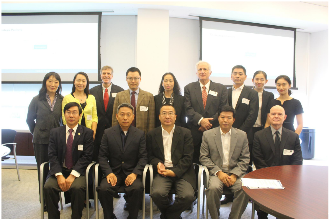
部分与会人员合影