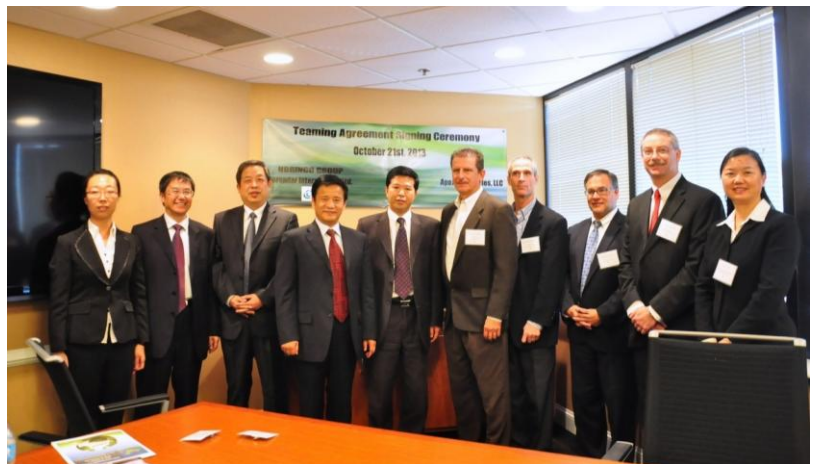
图3 IFCE 协助北方工程设计研究院与美国 APEX 公司签订战略合作协议