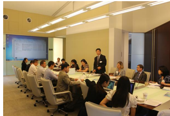
图2 IFCE 在华盛顿举办中美能效座谈会